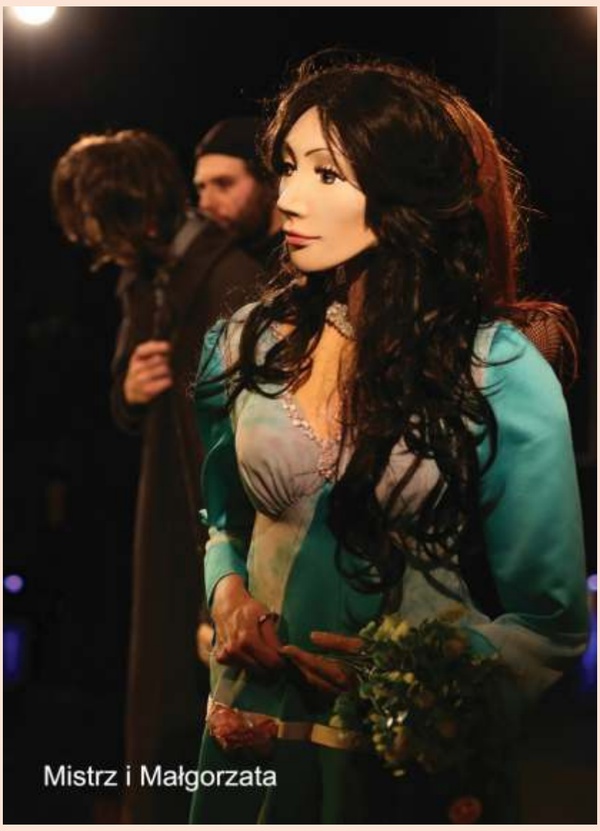
Mistrz i Małgorzata